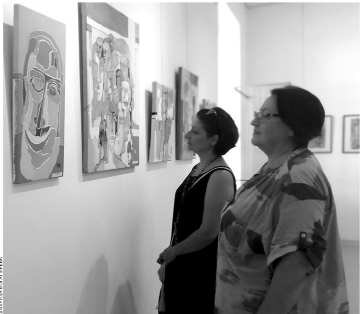
Картины Эдуарда Хавцева вызвали интерес у зрителей