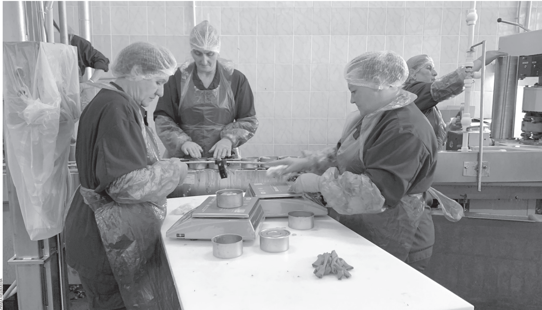
Контроль осуществляется на каждом этапе производственного процесса

продукция предприятия выпускается под брендами BazarCo и «Индийлайт». Одним из значительных преимуществ консервов «Дамате» является их длительный срок хранения — до двух лет.