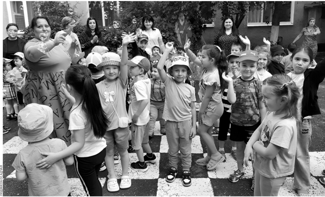
В садике «Вики» летние забавы с мыльными пузырями обожают и дети, и взрослые

Дежурный детсад, по определению, — это прежде всего про адаптацию. У маленького человека вдруг меняется большая часть жизни — он попадает в новую обстановку, его окружают незнакомые дети и взрослые, чужие лица. И для большинства детей самый сложный период — это утреннее расставание с домом. Чтобы оно прошло легче, в этом дежурном садике придумали совместную зарядку под любимую песню. К слову, у «Вики» (название дано в честь когда-то процветавшей советско-болгарской дружбы и персонажа, обнимающего земной шар), открытого в 1982 году, издавна сложилась завидная репутация, и сюда родители стремятся определить своих детей. Здесь всегда работали преподаватели специализированного дошкольного образования, вкла-