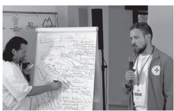
Один из рабочих моментов форума