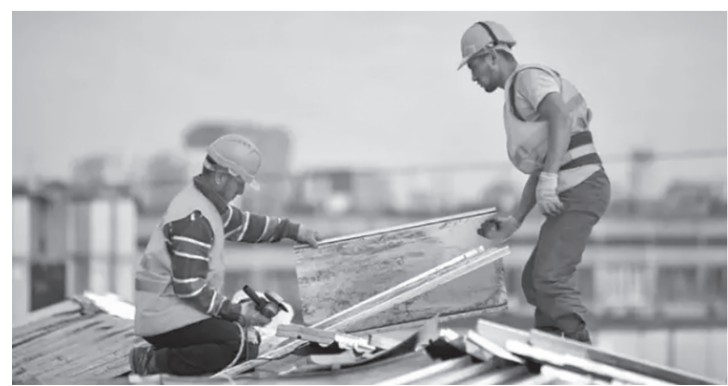
Работы по замене кровли идут полным ходом

В течение трех дней участники форума обменивались опытом, знаниями, мнениями.